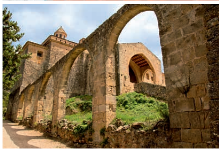
Vista panorámica de Horta de Sant Joan, Museo de Picasso y Convento de San Salvador

de la arquitectura. Seguimos nuestro camino por las calles concéntricas que antiguamente rodeaban el castillo, hoy desaparecido. Todo el casco antiguo está lleno de interesantes edificios de pedra sillar , donde apreciamos escudos, arcos ojivales y ricos trabajos en madera y forjados , como en la Casa Pitarch y la Casa Clúa. Desde ahí ponemos rumbo al Centro Picasso, ubicado en el antiguo hospital, un pequeño pero adorable museo que muestra la enorme influencia de Horta de Sant Joan en la obra de Picasso. Hacemos una pausa para comer crestó , un cabrito que se cría de forma semisalvaje en estas tierras y se cocina en escabeche , según una austera receta del siglo XIII. Y está... ¡para chuparse los dedos! Luego enfilamos hacia los Roques de Benet para ayudarnos a hacer la digestión. Dejamos el coche en el aparcamiento que hay junto al camino señalizado. La excursión no ofrece gran dificultad si vas con unos buenos zapatos que no